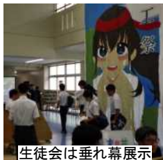
生徒会は垂れ幕展示