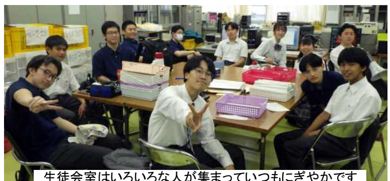
生徒会室はいろいろな人が集まっていつもにぎやかです

○書記、会計になるには、まずクラス代表になろう。9月のクラス役員選出の時にクラス代表に立候補しておいてください。その後で生徒会の先生と調整します。