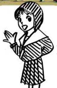
「意見」もお待ちしています。