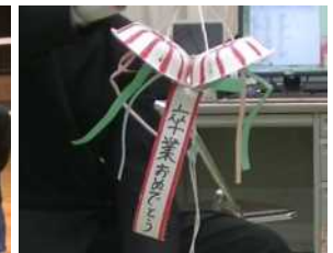
ささやかながらくす玉