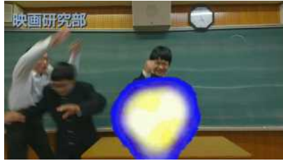
さすが映画研究部、ビデオ自作です