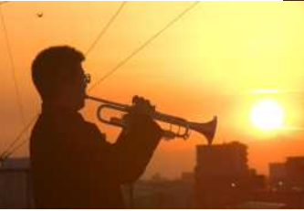
ハト？ カラスが飛んでました