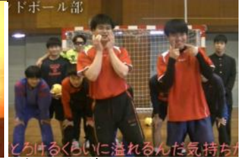
楽しい歌とダンス