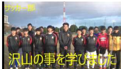
誰が話していたか分かりましたか