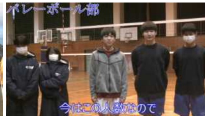
少ないけど頑張っています