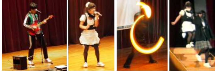
ステージどうでしたか？