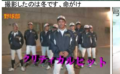
クリティカルヒット