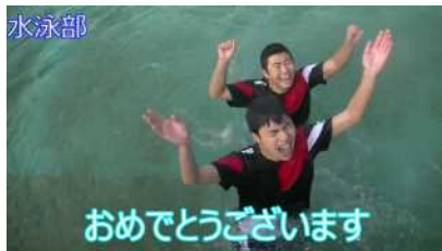
撮影したのは冬です、命がけ