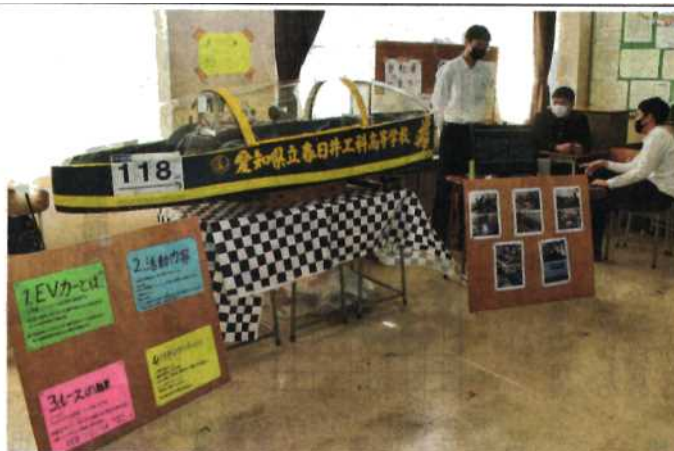
文化祭で展示された電気自動車「轟」。機械科の3年生が制作しレースで7位に入った=春日井市熊野町の春日井工科高で

機械科の電気自動車と文化祭の様子が中日新聞(10月31日付け近郊版)で紹介されました。(新聞社掲載許諾済)