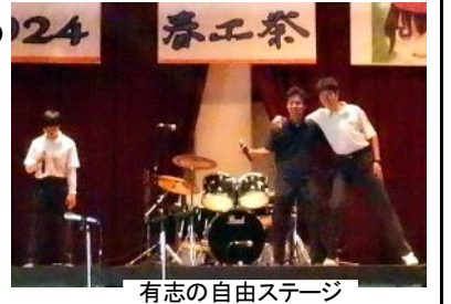
有志の自由ステージ

有志企画 バンド演奏やカラオケ、ダンスが得意な人は武道場での自由ステージ。写真やイラスト、模型など趣味の展示は有志展示。 皆さんのこだわりの世界を披露してください。